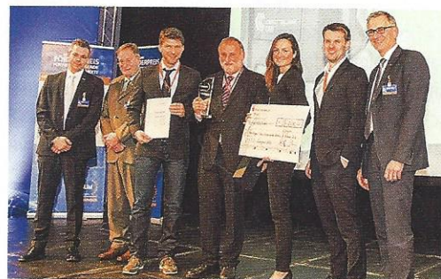
Das Team »Concept Cab Cluster« um die Firma Fritzmeier Systems gewann den VDBUM-Förderpreis in der Kategorie »Entwicklungen aus der Industrie«.